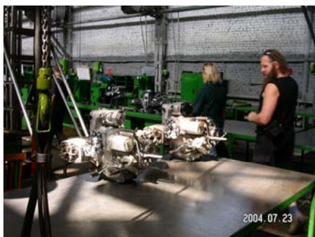
Das „Mekka“ aller Ural-Fahrer – das Irbiter Motorrad Werk

Übernachtung im Hotel Nica (sehr einfaches, aber einziges Hotel in Irbit)